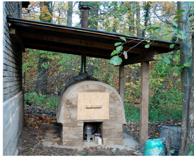
Lehmofen zur Pasteurisierung von Fäzes

Nach Anhang 2.2.1.1 der BioAbfV ist bei der Pasteurisierung eine Teilchengröße < 12 mm, eine gute Durchmischung und ein für den Wärmeübergang ausreichender (s.o.) Wassergehalt zu gewährleisten. Es müssen mindestens 70° C über mindestens 1 h auf das gesamte Material einwirken. Dies kann z.B. in einem Lehmofen und durch kurzes Umrühren des zu pasteurisierenden Materials realisiert werden.