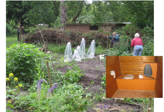
Der Wuhlegarten und der Innenraum der Trockentrenntoilette vor Ort 2014